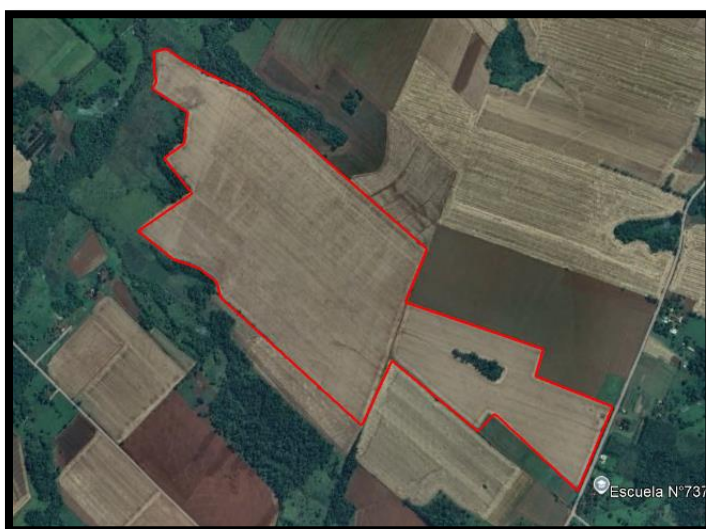
*Imagen del lote

El ensayo se llevó a cabo en un lote de 85 hectáreas (26°58'42.69"S, 55°48'0.22"O) destinado al cultivo de maíz, en el establecimiento de la empresa Agroganadera BUSS.