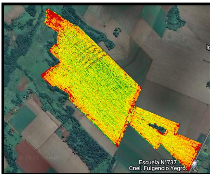
*Mapa de rendimiento de cosecha